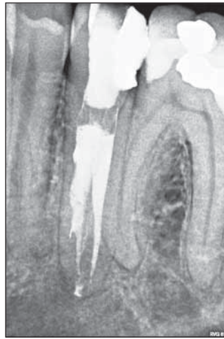
FIGURA 5. Control radiologic postoperativ al dintelui 35

La trei și respectiv cinci ani după tratament, s-au efectuat controale alveolare ale dintelui tratat. Dintele a fost