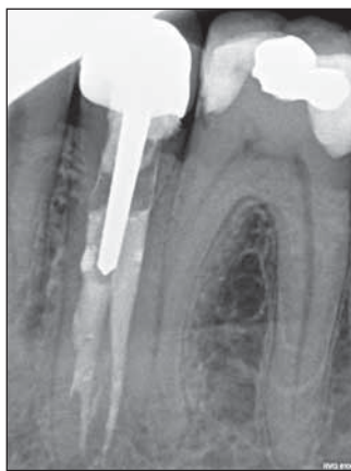
FIGURA 8. Radiografie de control postendodontic al dintelui 35 la cinci ani după tratament. Nu se constată semne radiologice de afecțiuni apicale

zului premolarilor, diagnosticul nu se poate pune clinic, ci numai pe baza analizei radiografiei.