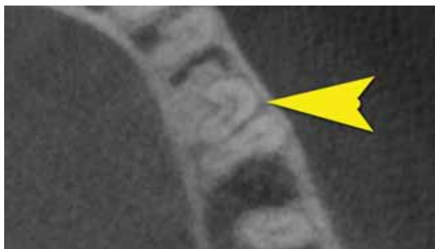
FIGURA 2. Imagini tomografice. Pe secțiune axială se pot identifica două canale radiculare separate (a). Analiza secțiunii coronale arată prezența unei configurații atipice de tipul c-shaped (b)