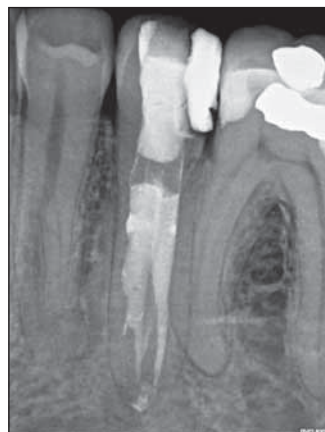
FIGURA 7. Radiografie de control postendodontic al dintelui 35 la trei ani după tratament. Se constată acoperirea dintelui cu o coroană de înveliș. Nu se constată semne radiologice de afecțiuni apicale

între timp acoperit cu o coroană de înveliș. Examele clinice și radiologice (Fig. 7 și 8) nu prezintă semne de modificări patologice.