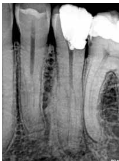
FIGURA 1. Radiografie intraorală diagnostică preoperatorie a dintelui 35. Se poate constata prezența taurodontismului. Analiza radiografiei arată prezența a două rădăcini.