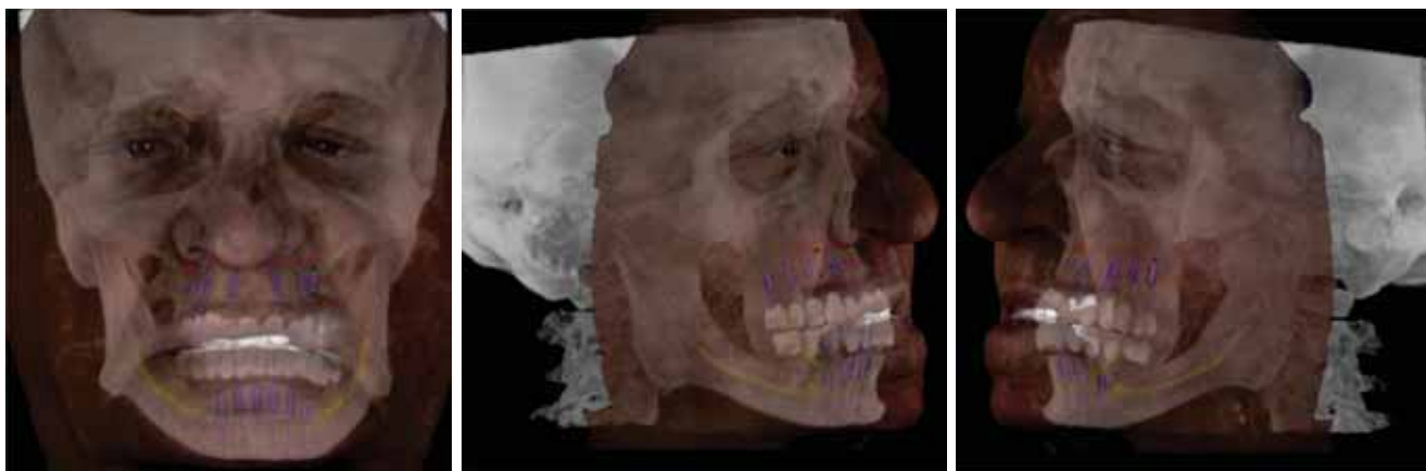
FIGURILE 3, 4, 5 Scanarea facial suprapusă peste CBCT din normă frontală și laterală

măsurători, ajustări și suprapuneri sunt generate o multitudine de date și parametri utili în terapia edentației totale la pacienți cu așteptări estetice ridicate.