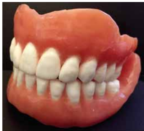
FIGURA 1. Proteze totale convenționale cu dinți radioopaci

Prima etapă clinică a constat în efectuarea a două proteze totale convenționale cu dinți radioopaci, ca prefigurare a relațiilor intermaxilare de ocluzie corecte – în vederea efectuării CBCT-ului diagnostic cu protezele aplicate pe câmpul edentat total, astfel încât să procedăm la planificarea poziției de inserare a implantelor din punct de vedere protetic în raport optim cu viitoarele arcade dentare. Simularea poziționării implantelor și dimensiunea acestora au fost ghidate de examinarea clinică